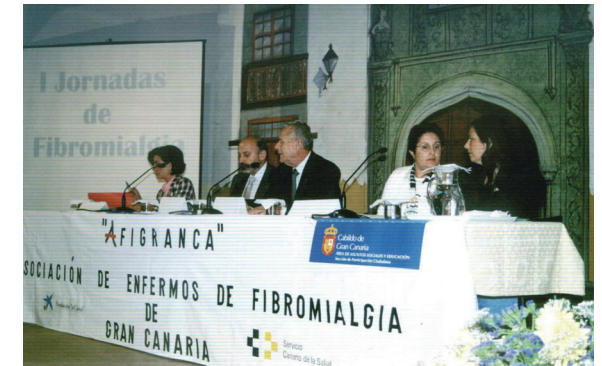
I Jornadas de Fibromialgia en Canarias celebradas en Marzo de 2002

En Octubre de 2007 se han asociado en Afigranca 399 personas afectadas y diagnosticadas de Fibromialgia y/o fatiga crónica.